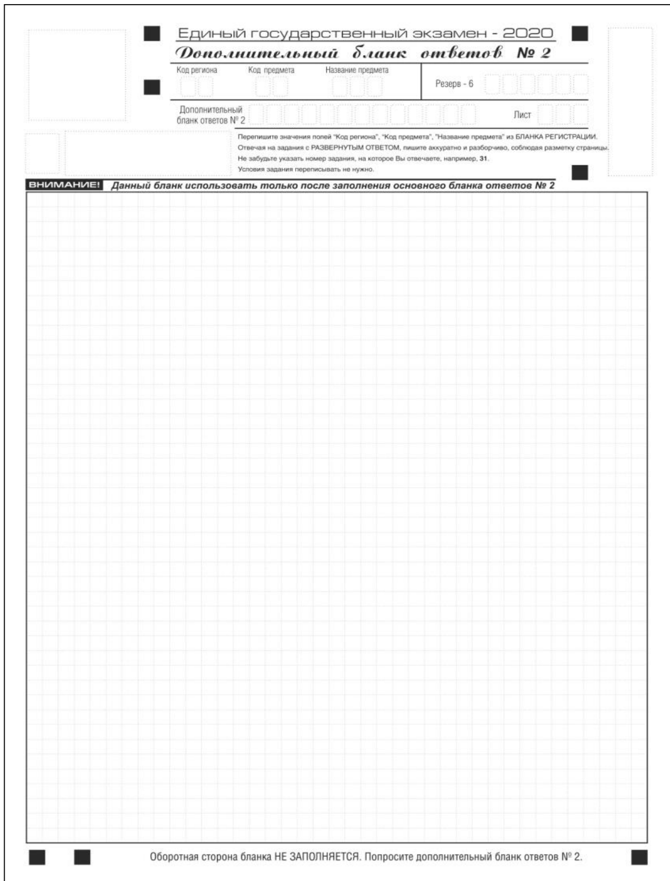
Рис. 15. Дополнительный бланк ответов № 2